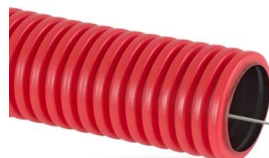
Двуслойные гибкие электротехнические трубы SN6 с протяжкой в бухтах