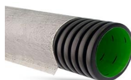
Жёсткая двуслойная труба «Ростпайп» SN10 с перфорацией с геотильтром