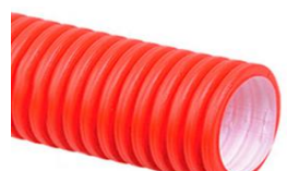
Двуслойные жёсткие электротехнические трубы SN8 в отрезках