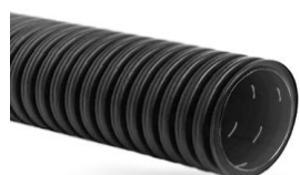
Двуслойные гибкие ПНД SN6 с геотильтром