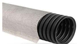
Однослойная с перфорацией в геотильтре