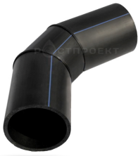
Отвод сегментный 5 - 45°