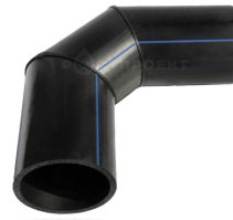
Отвод сегментный 50 - 90°