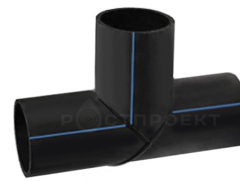
Тройник 90° сегментный